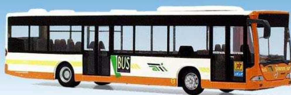
Mercedes-Benz Citaro "ATI" (Piemonte) "Azienda Transporti Interurbani" 83016