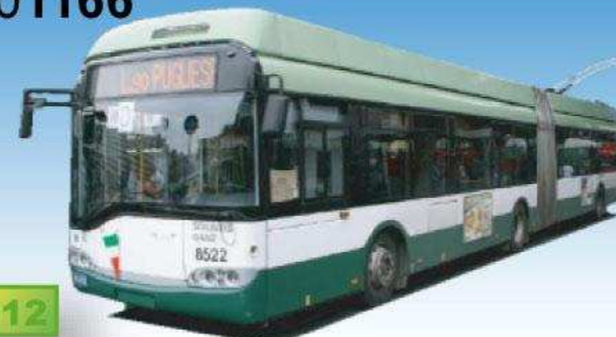
Solaris Trollino T18 II Filobus (articolato), "ATAC" - (RM) Roma 08701166