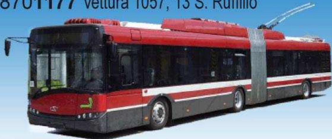
Solaris Trollino T18 III - "ATC" Bologna 08701177 vettura 1057, 13 S. Ruffillo

Il nuovo modello del Trollino in versione ATC Bologna differisce da altri modelli per il rivestimento dell'imperiale che è stato modificato. Sono anche riprodotti gli arrotolatori posteriori e la copertura del motore ausiliario sul tetto.