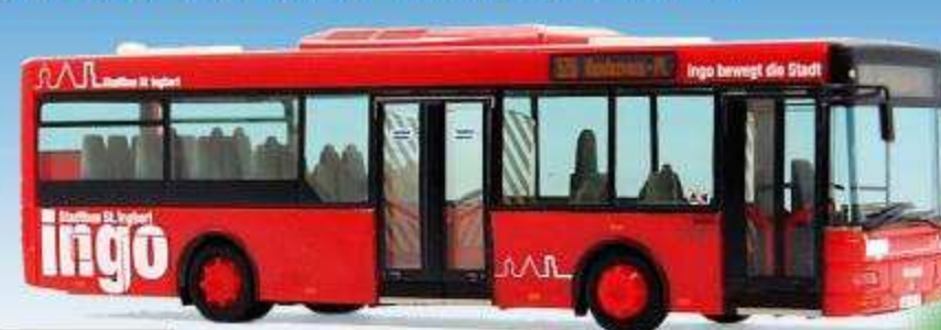
MAN NM223.2 - Stadtbus St. Ingbert 08700923-1 521 Rohrbach Nord 08700923-2 526 Rendezvous Pl.