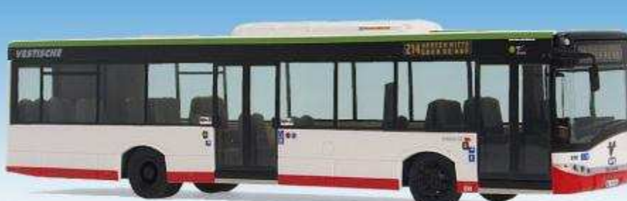
Solaris U12 - Vestische, Herten 08701901-2 Wg.2311, 214 Herten Mitte