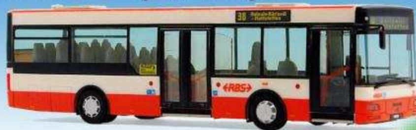
MAN NM 223.2 - RBS Solothurn 08700915-1 Wg.21, 38 Bärswil 08700915-2 Wg.22, 43 Ittigen