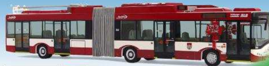
Solaris Trollino 18 - SLB Salzburg Fahrerseitig mit vorbildgerecht längerer Dachverkleidung. 08701133-4 Wg. 304, 6 Itzling-West