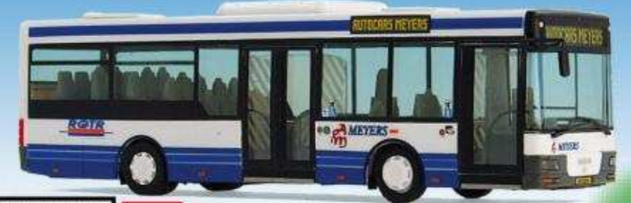
MAN NM 223.2 - AM Autocars Meyers 08700910-1 605 Hoscheid 08700910-2 Autocars Meyers