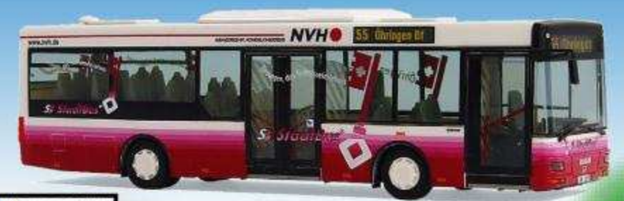
MAN NM 223.2 - NVH Hohenlohekreis 08700924 55 Öhringen Bf