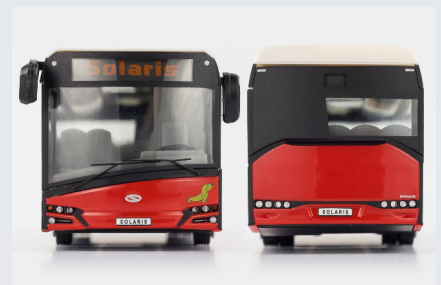
24004 rot mit Radkappen und zusätzlichen Aufdrucken - weiße Werbeverpackung

(Exklusivmodell für die Fa. Solaris www.solarisbus.com )