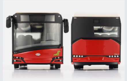
24002 rot mit Stahlfelgen - Serienmodell

http://www.vk-modelle.de/pressebilder/24002.zip