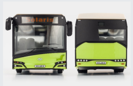
24003 hellgrün mit zusätzlichen Aufdrucken - hellgrüne Werbeverpackung

(Exklusivmodell für die Fa. Solaris www.solarisbus.com )