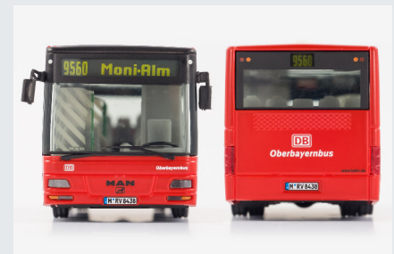
RVO Oberbayernbus München 09305 Wagen M-RV 8438, Linie 9560 Moni-Alm (Exklusivmodell für bahnshop.de )

http://www.vk-modelle.de/pressebilder/09305.zip